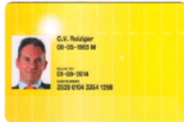
Voorbeeld van een persoonlijke OV-chipkaart