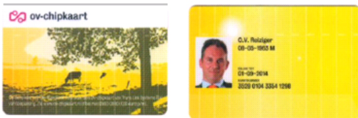
Voorbeeld van een persoonlijke OV-chipkaart

Er bestaan ook persoonlijke OV-chipkaarten. Hierop staan uw naam, geboortedatum en pasfoto. Een voordeel van deze persoonlijke kaart is dat u abonnementen op de kaart kunt zetten of met leeftijdskorting kunt reizen. U moet deze kaart zelf kopen. Hiervoor heeft u een eigen bankrekening nodig. Dit kan niet met een Moneycard.